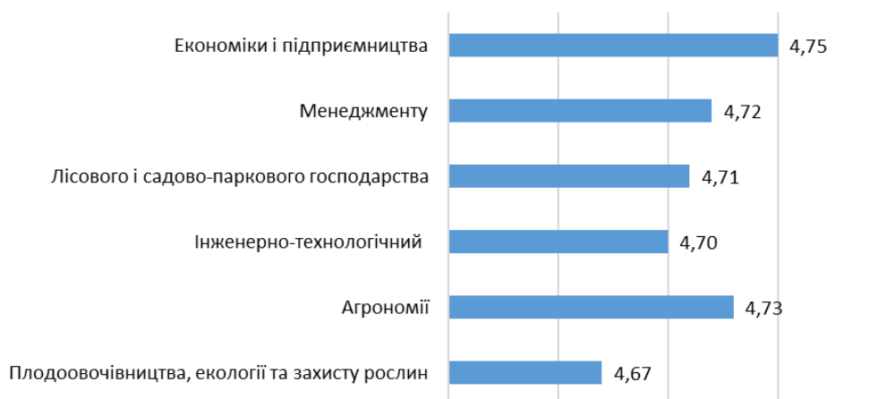
Рис. 3. Оцінка якості викладання навчальних дисциплін, на думку опитаних здобувачів вищої освіти (у балах)

Також на рис. 4 можемо бачити, як оцінюють якість викладання навчальних дисциплін здобувачі по курсах та рівнях вищої освіти.