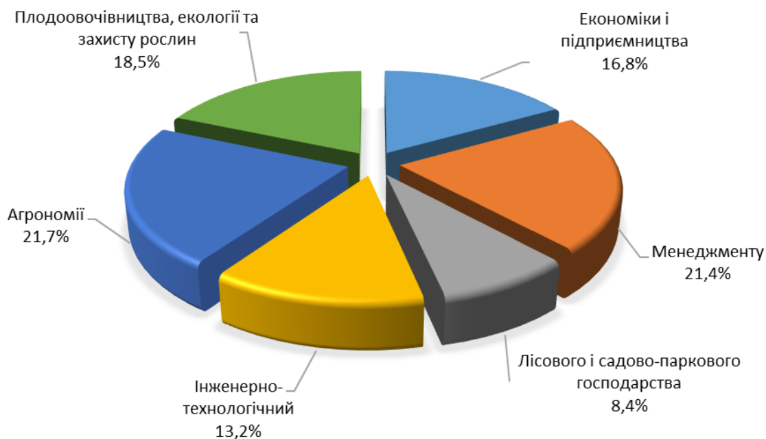
Рис. 1. Активність респондентів у розрізі факультетів (у відсотках)

В опитуванні взяли участь 1193 студенти 6 факультетів. Частку респондентів у розрізі факультетів ілюструє рис. 1.