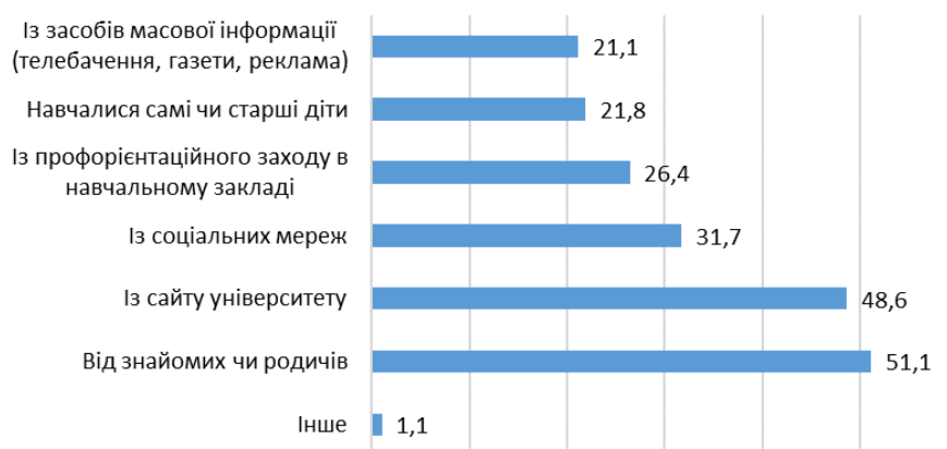
Рис. 2. Джерела інформації, з яких батьки вступників дізнались про університет (у відсотках)

соціальних мереж. Серед інших джерел були «бажання дитини» та «раніше проживали в цьому місті».