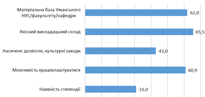
Рис. 3. Критерії комфортного навчання для абітурієнтів (у відсотках)

Аналіз відповідей на запитання «Які критерії важливі для комфортного навчання Вашої дитини?» представлено на рис 3.