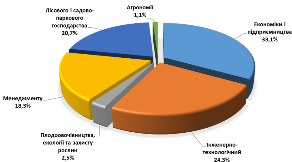
Рис. 1. Активність респондентів у розрізі факультетів, на які вступали абітурієнти (у відсотках)

До он-лайн анкетування долучилися 284 батьків абітурієнтів УНУС. Частку респондентів у розрізі факультетів, на які вступили їхні діти, ілюструє рис. 1.